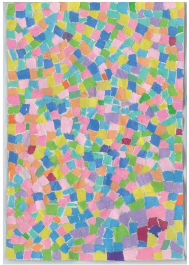
タイトル: 華やかな色 作者: AYA