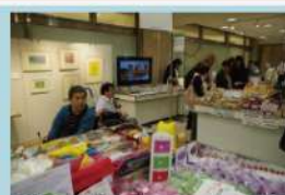
沢山の商品がありました。

5月29日(金)～6月1日(月)まで開催された「第1回 福祉ものづくり展」に企画5人で行って来ました。全国の障がい者施設で製造された食品やアクセサリなどを販売するイベントで、ひこうせんのブースもあり、珍しい商品もあり沢山で多数の人で賑わってました。帰りに吉祥寺の障がい者の手作り品を専門に扱っている「マジェルカ」にも寄りました。カラフルな作品が並ぶおしゃれな店内はとても素晴らしく、販売の良い参考になりました。