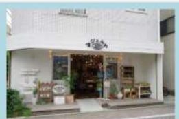
吉祥寺「マジェルカ」