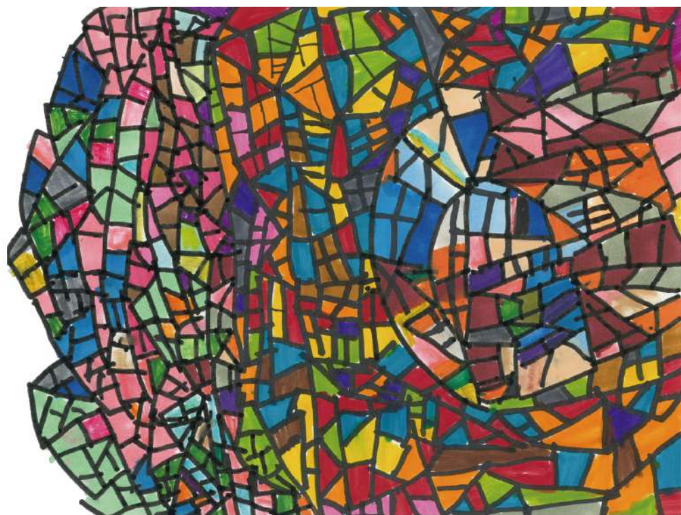
タイトル：ステンドグラス 作：EM I